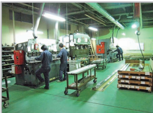
工場直営 の生産体制

『ご注文を受けた商品はその日のうちに配送する』が当社の顧客サービスのモットーです。コンピュータによる顧客管理により、送り状や荷札のデータ化を実現。近畿圏はもとより、関東、北陸、中部、中国、九州にまで即納体制を整備。商品にキズを付けないよう、細心の注意を払って配送いたします。